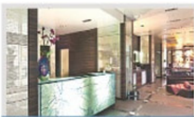
Ambientes con diseño de lujo