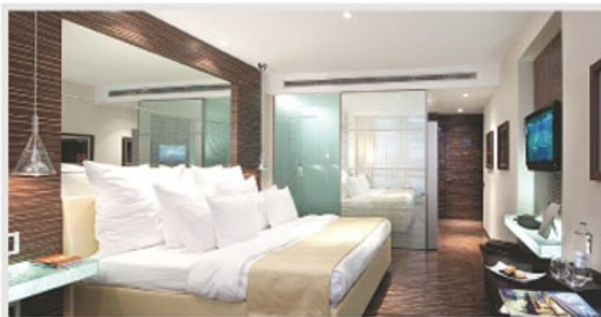
Las grandes habitaciones del Romeo Hotel tienen muebles de diseño, cafetera Nespresso, telas Capri y artículos de cuero Tramontano.