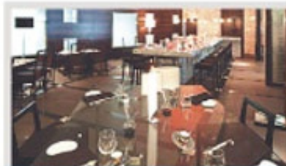
Un restaurante sofisticado