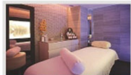
Tratamientos en Dogana del Sale Spa

modidades y atención al detalle. Las fantásticas vistas panorámicas, los colores cálidos, la elegancia de los muebles y los accesorios ayudan a crear un ambiente relajante.