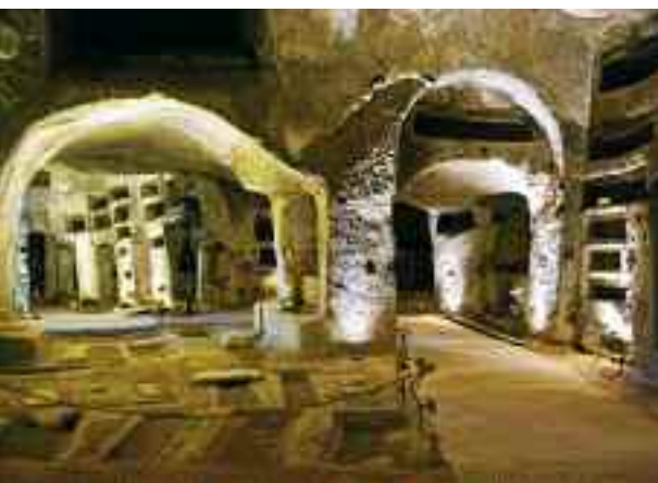
Sopra, le catacombe di S. Gennaro, a due piani, ornate da pitture rupestri. Qui si trova la prima raffigurazione del Santo.

rituali funebri, esoterici, massoni e persino camorristici, sono diventate nel dopoguerra ricettacolo di macerie e rifiuti di ogni tipo, comprese negli anni Sessanta le auto e le moto sottoposte a sequestro giudiziario. Trasformate in discariche abusive o riempite indiscriminatamente di calcestruzzo ora, grazie all'opera di speleologi e volontari, fra cui una cooperativa giovanile del Rione Sanità, sono state ripulite e rese visitabili. Così, occupati stabilmente da un solo abitante, il dollicopode, un animaletto a metà strada fra un ragno e un grillo, con un'umidità del 90% e una temperatura di 17 gradi, gli scavi archeologici di S. Lorenzo Maggiore, il teatro greco-romano in cui si esibì Nerone e il cimitero delle Fontanelle (chiuso lo scorso aprile per il crollo di una parte della volta), pile di teschi, emblema di anime del Purgatorio, adottati dai napoletani in cambio di