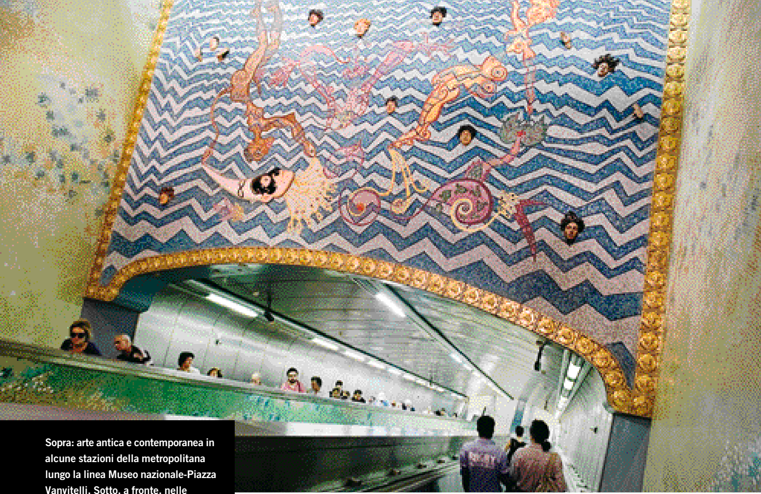
Sopra: arte antica e contemporanea in alcune stazioni della metropolitana lungo la linea Museo nazionale-Piazza Vanvitelli. Sotto, a fronte, nelle catacombe di San Gaudioso, cui si accede da S. Maria della Sanità; una cisterna nel tunnel borbonico.