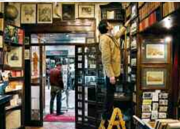
La cupola di S. Gregorio Armeno; piazza S. Gaetano; la libreria Colonnese, fondata nel 1965, anche casa editrice, promuove, performance, dibattiti, eventi culturali. A fronte, il chiostro di S. Gregorio Armeno; il ristorante La stanza del gusto e piazza Bellini.