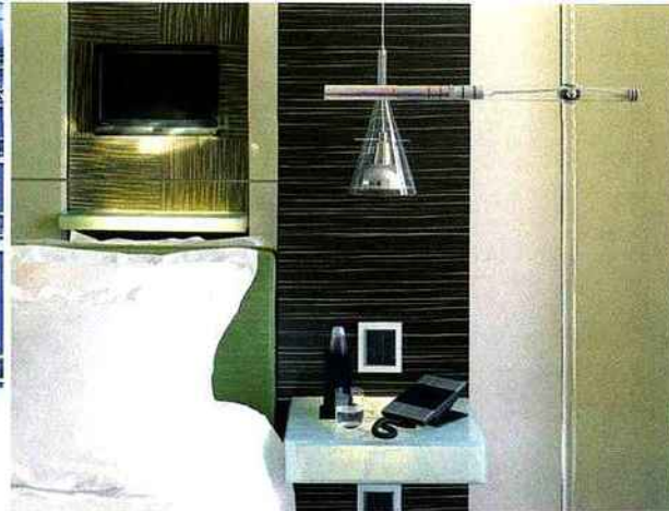
Ci-dessus , chambre ultra-lumineuse et façade de verre. Modernité des lignes avec vue sur la gare maritime et le Vésuve.